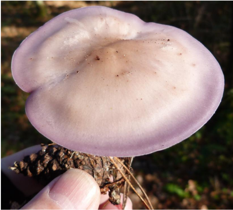
De paarse schijnridder stond er blozend bij