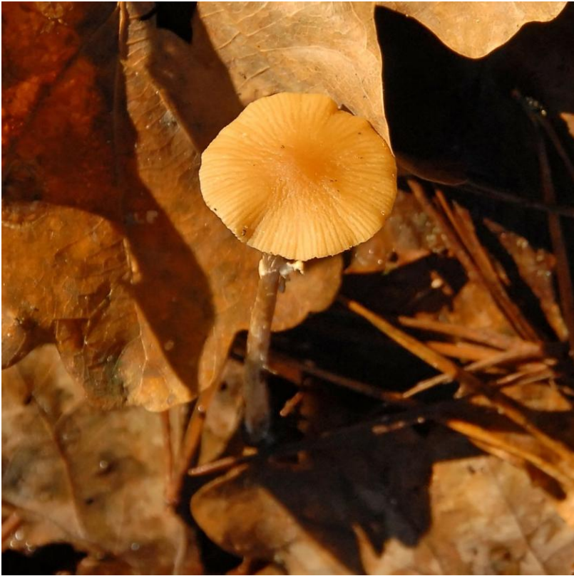
Het breeksteeltje een schattig ding