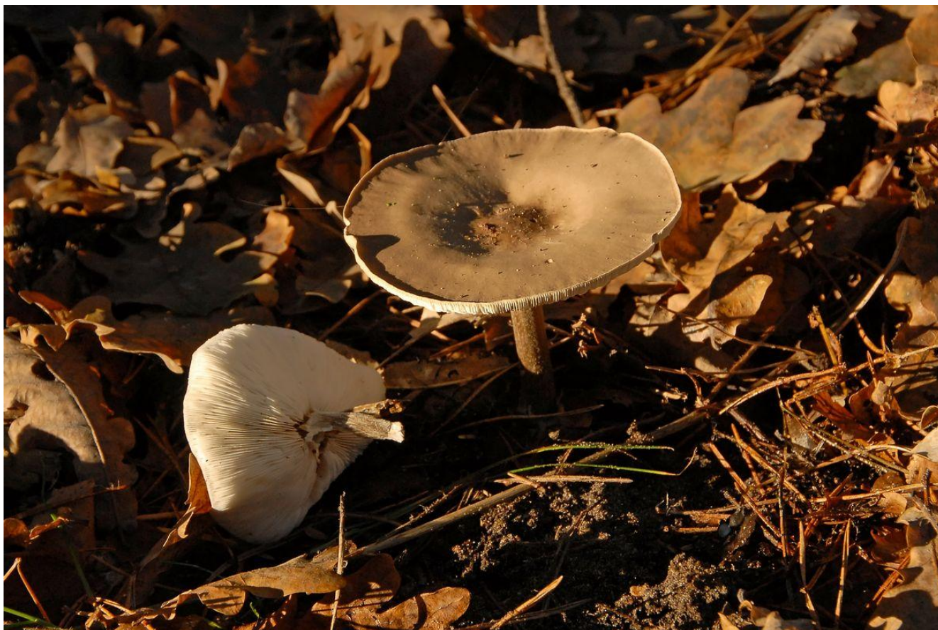
De zwartwitte veldridder