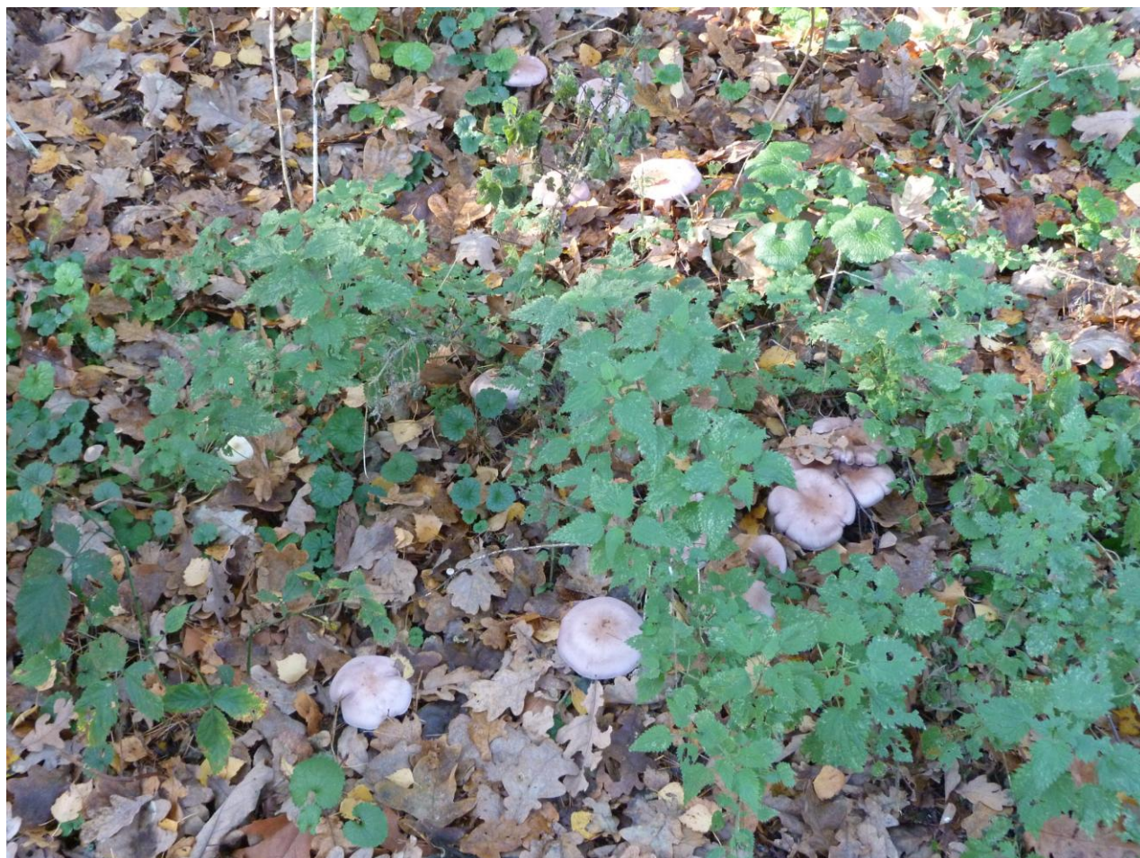
Tot slot van de wandeling een mooie collectie nevelzwammen