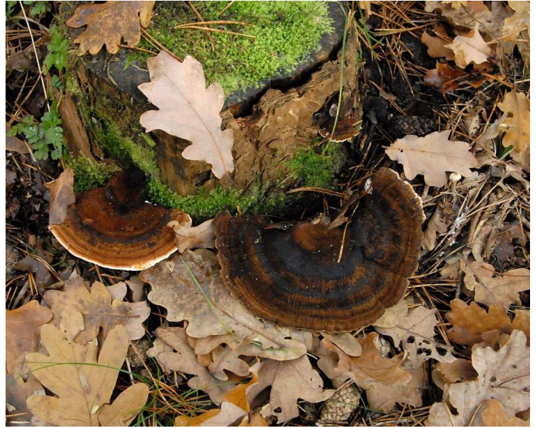
De teervlekkenzwam van haar boomstronk gehaald