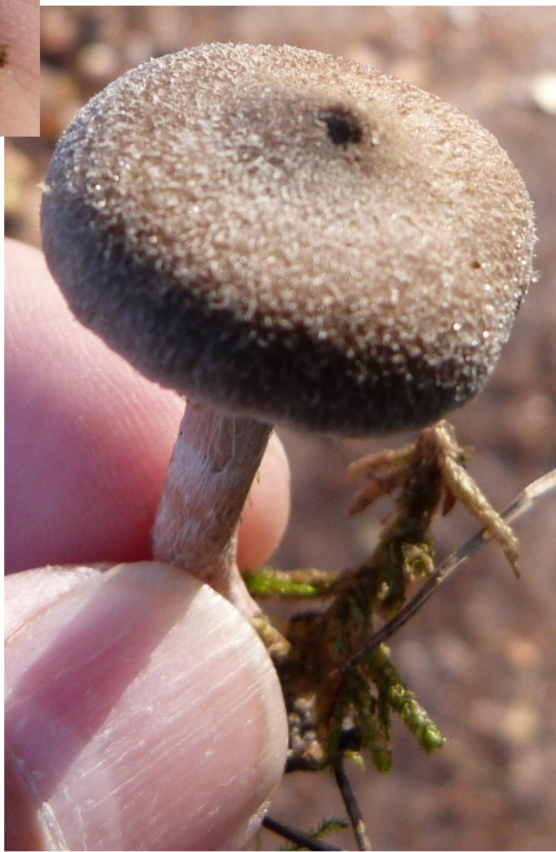
De witschubbige gordijnzwam