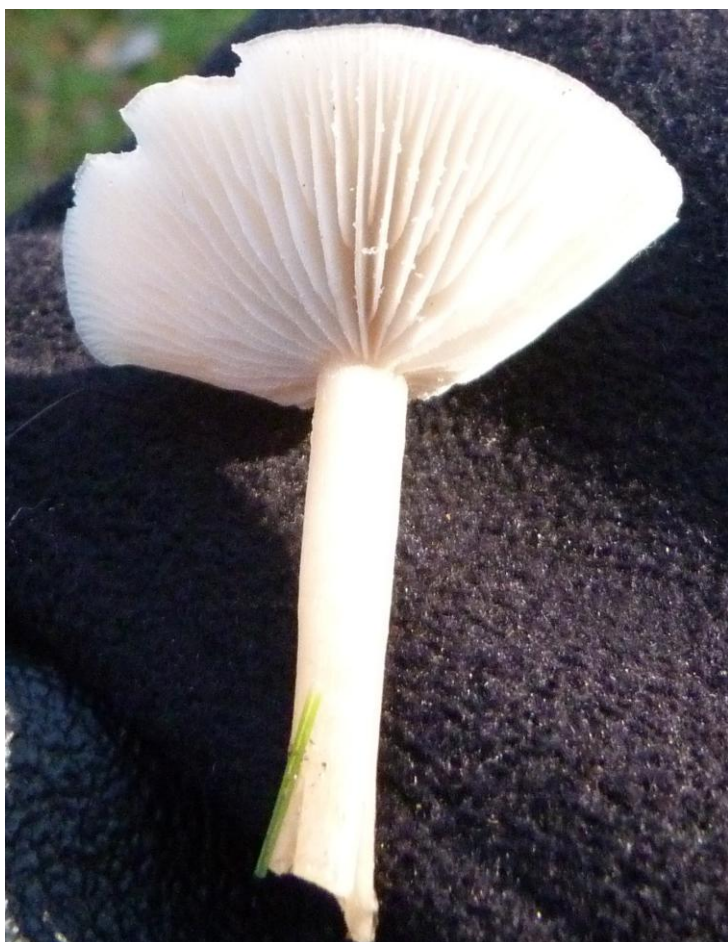
De slanke anijstrechter nog zo'n geurige jongen